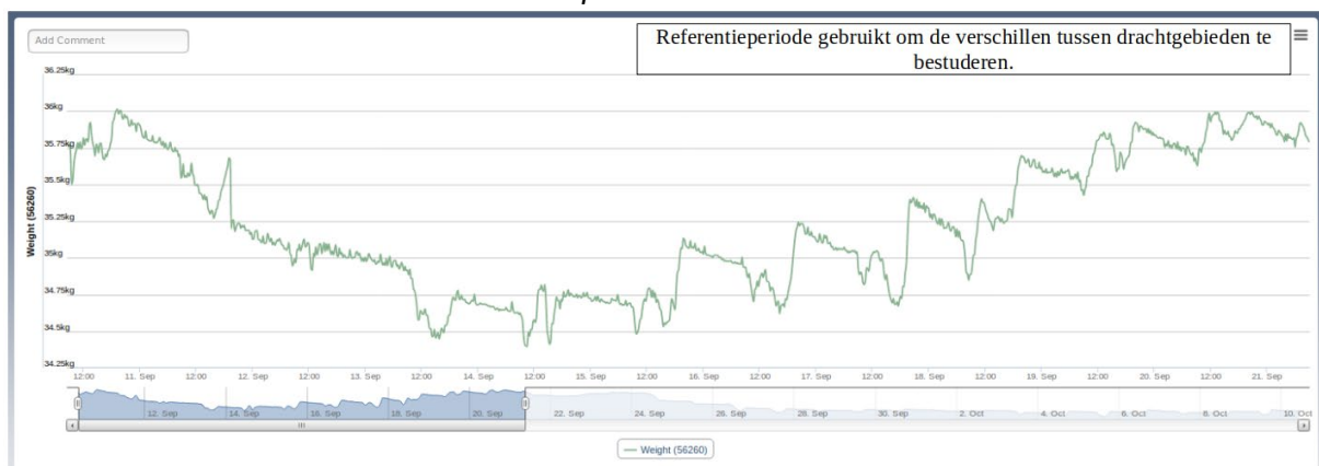
Figuur 3: Gewichtsveranderingen in alle Arnia systemen tijdens periode van 15 tot 21 september 2018

De data van 23 locaties zijn bruikbaar voor deze vergelijking. De andere Arnia-systeem waren ofwel nog niet actief gedurende de hele periode of vertonen onregelmatigheden in de data