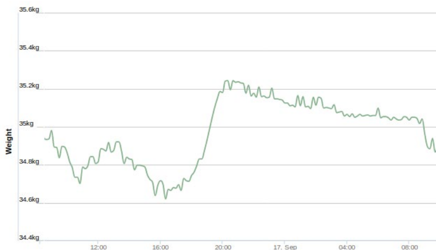
Figuur 1: Gewichtsveranderingen op 16 september 2018, gemeten door Arnia

Het gewicht van de kast is op de ochtend van 16 september 34,94 kg (zie figuur 1). Eenmaal de temperatuur boven de 12°C komt, zien we een dip in het gewicht: de eerste lading haalbijen verlaat de kast. Gewicht zakt tot 34,70 kg om 11u. Hierna komen volgeladen haalbijen terug en is er een druk op en afvliegen: het gewicht schommelt. Rond 16u is er de hoogste activiteit en zijn het grootste aantal vliegbijsen buiten de kast. Iets na 18u begint het sterk af te koelen en komen alle haalbijen terug in de kast. Om 20u weegt de kast 35,20 kg. Er is dus een gewichtstoename van 260 gram op 16 september. Dit is stuifmeel en nectar die binnengekomen is. Er zal iets meer binnengekomen zijn, aangezien er ook consumptie geweest is gedurende de dag en er haalbijen gesneuveld zijn bij het uitvliegen. Dit is echter niet meetbaar. Gedurende de nacht zien we dat het gewicht afneemt met 160 gram tot 35,04 kg. Te verklaren door het verdampen van water uit de binnengekomen nectar en consumptie door de bijen om het broed warm te houden.