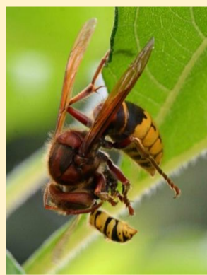
Europese hoornaar met prooi