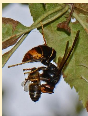
Aziatische hoornaar met prooi

Het nest laten verdelgen is de enige oplossing om de Aziatische hoornaar af te houden. Markeer vliegroutes op een kaart ter indicatie van de nestplaats en zoek samen met burens naar het nest. Meld je waarneming aan Honeybee Valley die het nest in samenspraak met de brandweer zal verdelgen. Verdelg nooit zelf!